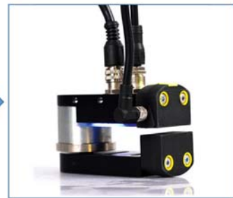
All In One System SAFIX und HOLDX