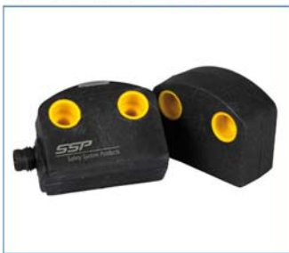
Safety RFID Sensor SAFIX