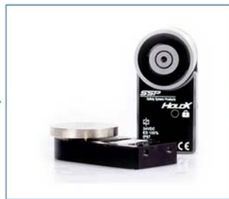
Prozesszuhaltung HOLDX S1